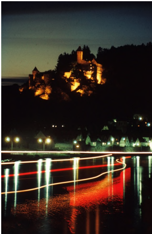
Sehr lange Belichtungszeit (ca. 3 Minuten). Die Lichtspur stammt von einem langsam verbeifahrenden Schiff.

Längere Belichtungszeiten sind bei den nachfolgenden Bildern erforderlich