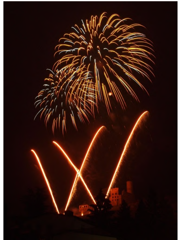
Aufnahme mit offenem Verschluss, bis die Raketen abgefeuert waren.